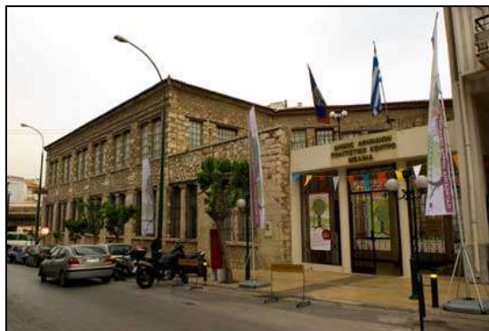
Πολιτιστικό Κέντρο «Μελίνα» Θεσείο, Αθήνα

ΘΕΣΣΑΛΟΝΙΚΗ: Έκθεση μαθητών Β. Ελλάδας θα πραγματοποιηθεί στην Εταιρεία Μακεδονικών Σπουδών . Διάρκεια: από 1-15 Μαΐου 2017.