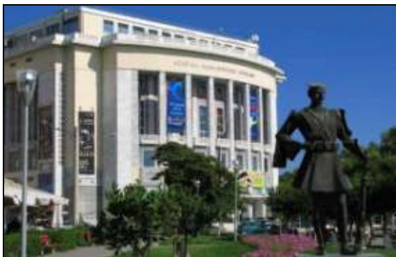
Εταιρεία Μακεδονικών Σπουδών - Θεσσαλονίκη