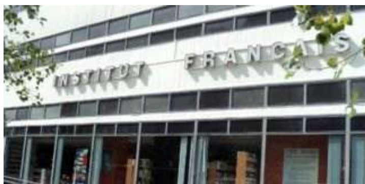
Γαλλικό Ινστιτούτο - Θεσσαλονίκη