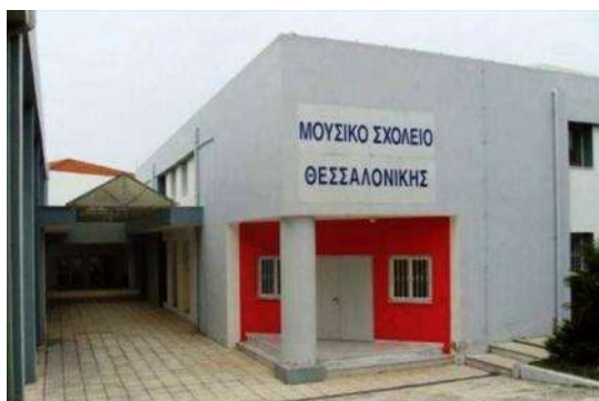
Μουσικό Σχολείο Θεσσαλονίκης - Πυλαία