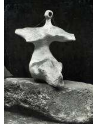
Αντουάν Μπουρντέλ: «Πολλές πολιτείες χάθηκαν, πολλές χώρες σκοτείνισαν, εκείνο που έμεινε, εκείνο που μένει, είναι η ομορφιά της Τέχνης και η Σκέψη»

Χένρυ Μουρ: «Πιστεύω ότι το σχέδιο πρέπει να διδάσκεται με σοβαρότητα ακόμη και στα Δημοτικά σχολεία σαν ένα μέρος της Γενικής Εκπαίδευσης, πολύ περισσότερο απ' ό,τι τώρα, όχι με σκοπό να παράγει μεγάλο αριθμό ζωγράφων και γλυπτών, αλλά για να μάθει τα παιδιά να κοιτάζουν, να χρησιμοποιούν τα μάτια τους. Τα παιδιά μαθαίνουν ότι η γλώσσα είναι ένας τρόπος επικοινωνίας του μυαλού, και ότι η μουσική είναι επικοινωνία μέσω του αυτιού, όμως δεν διδάσκονται να χρησιμοποιούν τα μάτια τους για να κατανοήσουν τη φύση και να τραφούν από τις εικαστικές τέχνες.